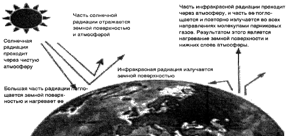
Рисунок 2 – Схема парникового эффекта