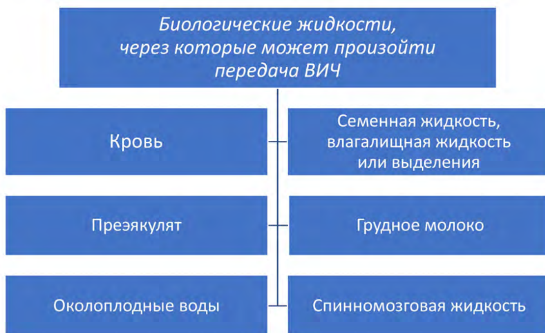
Рис. 1. Биологические жидкости, через которые может произойти передача ВИЧ

Неверное представление о биологических жидкостях, через которые может произойти инфицирование ВИЧ, является распространенной причиной страха и непонимания и способствует усилению дискриминации в отношении людей, живущих с ВИЧ (рис. 1). Под биологическими жидкостями организма подразумеваются все жидкости, выделяемые человеческим телом, а не только те, которые участвуют в передаче ВИЧ.