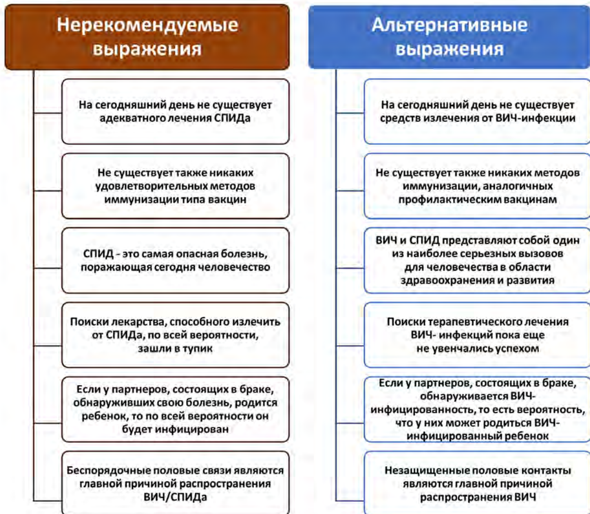
Рис. 3. Примеры нерекондуемых выражений и их альтернативы

Мы приводим примеры нерекондуемых выражений и их альтернативы (рис. 3).